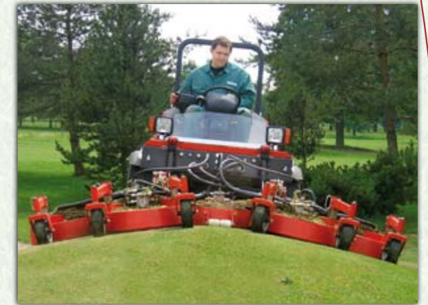
Frontsichelmähwerk FSM3000H Golf Arbeitsbreite 3 m