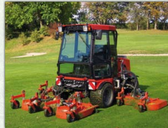
Frontsichelmähwerk FSM4000H Arbeitsbreite 4 m