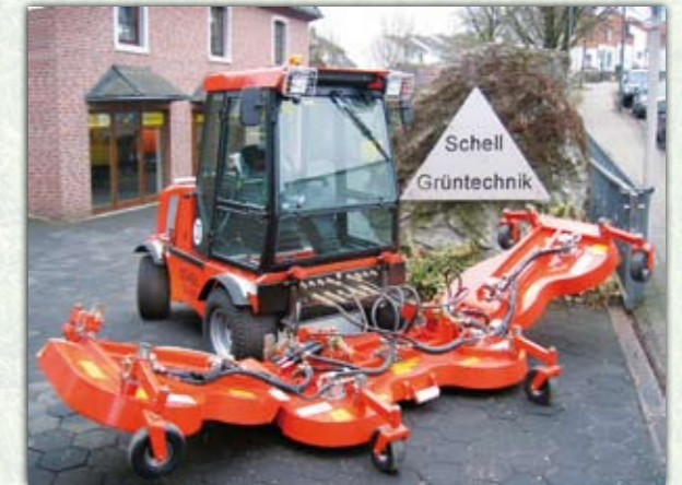
Frontsichelmähwerk FSM4200H Arbeitsbreite 4,2 m

Weiterhin bieten sich einige Anbaugeräte hervorragend als Ergänzung an, um das Pflegefahrzeug als Geräteträger das ganze Jahr über effektiv zu nutzen.