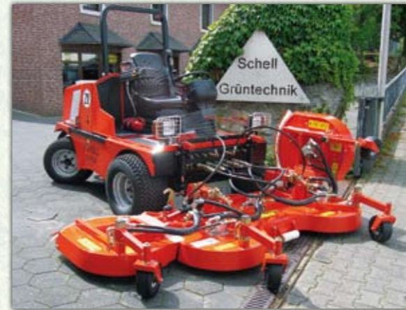
Frontsichelmähwerk FSM3000H Arbeitsbreite 3,00 m

Die Auswahl an Mähwerken und das Aufnahmesystem lassen keine Wünsche offen, um die perfekte Mähkombination mit dem Trägerfahrzeug auch bei den schwierigsten Voraussetzungen zu erfüllen.