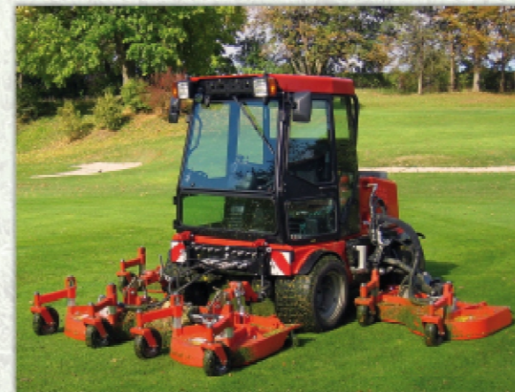
Tondeuse frontale FSM4000H Vario - Largeur de travail 4 m