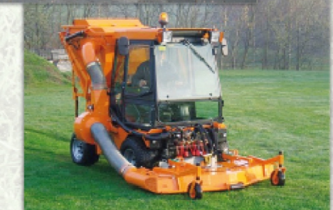
Aspirateur d' herbe et de feuillage GC1000