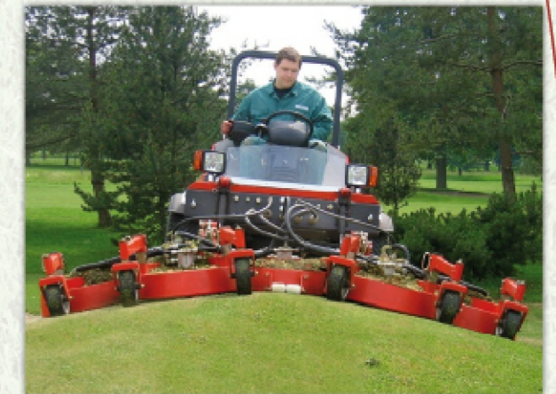
Tondeuse frontale FSM3000H Golf - Largeur de travail 3 m