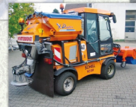
Expandeur de sel