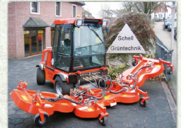
Tondeuse frontale FSM4200H - Largeur de travail 4,2 m