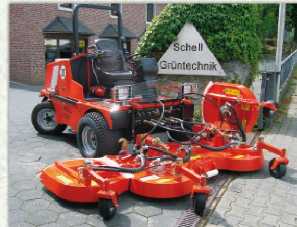
Tondeuse frontale FSM3000H - Largeur de travail 3,00 m

Machine de base polyvalente. Elle peut être équipée avec plusieurs types d'accessoire (tondeuse,...). Une excellente machine de base pour le montage de tondeuse, pour accomplir les travaux lourds.